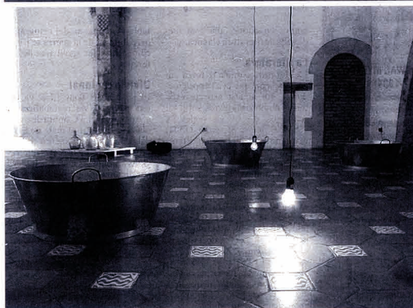
Dues de les instal·lacions que formen part de l'exposició d'Ester Ferrando que es pot veure a l'Antic Ajuntament de Tarragona.

soldre's i desaparèixer, la sensació de poder ser engolits com les gotes d'aigua que se senten caure.